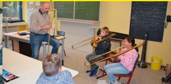
Kooperation mit der Musikschule