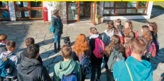
Außerschulischer Lernort Nationalpark