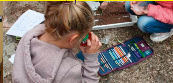
Wildwiesenprojekt mit Grundschulern