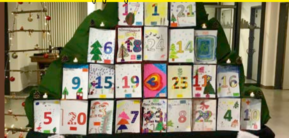
Begegnung der Generationen