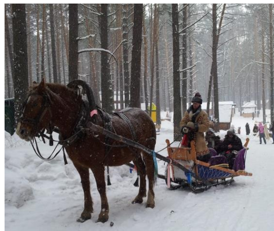
Schlittenfahrt im Freilichtmuseum

Die russischen Schülerinnen und Schüler, die Deutsch lernen, nehmen sehr gern die deutschen Gäste vom GAT auf.