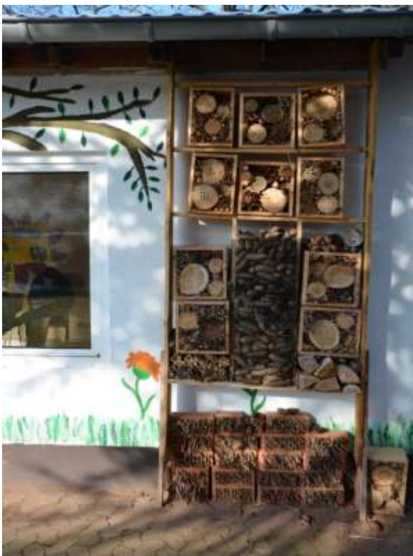
Das erste Insektenhotel